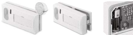
Rys. 1. otwarcie Rys. 2. zamknięcie Rys. 3. polaryzacja baterii

Uwaga: istnieje możliwość zastosowania aż 8 nadajników . Jeżeli do 1 minuty przy wprowadzaniu kodu nie wysłamy sygnału z nadajnika musimy nauczenie przeprowadzić od początku ( od a, do c, ).